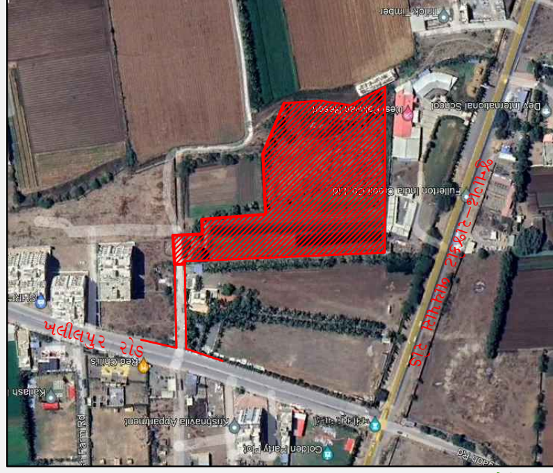
SANSKAR RESIDENCY SITE PLAN